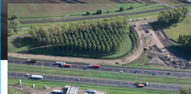
Vorbereidingen nieuwe op- en afrit A16 bij Moerdijkbrug

Rijkswaterstaat legt volgend jaar nog de parallelbaan naast de A16 aan, waardoor het verkeer richting Breda straks net voor de Moerdijkbrug invoegt op de A16. De doorstroming zal daardoor naar verwachting verder verbeteren. Ook worden nog de zuidelijke op- en afritten voor DistriPark Dordrecht bij de Moerdijkbrug aangelegd. Volgend jaar juli zit het werk van Rijkswaterstaat voor de aansluiting A16/N3 erop. De zuidelijke op- en afritten kunnen pas in gebruik worden genomen als de aansluiting op de rotonde bij DistriPark Dordrecht in oktober 2021 klaar is. Dit deel wordt door de gemeente uitgevoerd.